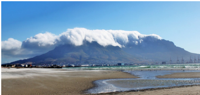
Le fameux «waterfront»